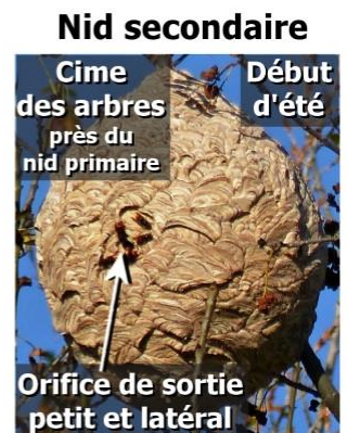
Grande taille Jusqu'à 80 cm de diamètre et 1 m de haut