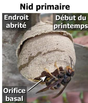
Petite taille D'un melon au maximum